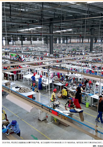
2018年，莱基自贸区服装制造业生产车间，员工在流水线上为非洲制造3.5万个服装样品。每天生产3000件服装并出口到欧美。

非洲国家开始了新的发展探索，效仿亚洲一些国家的发展经验，重视局部推动，建设工业园以吸引外商投资，实施出口导向战略。在这方面，非洲拥有全球贸易优惠的巨大优势。2001年，欧盟与部分非洲、加勒比和太平洋国家签署协议《除武器外一切都行》(Everything But Arms, EBA)，允许最不发达国家的商品（武器除外）进入欧盟市场时享受免关税、免配额的优惠待遇。2015年6月29日，美国与非洲国家签署了《非洲增长与机遇法案》(AGOA)修正案，延续了原有的AGOA条款。该法案免除了来自撒哈拉以南非洲国家的产品进入美国市场的配额限制和关税，撒哈拉以南的39个非洲国家享有相应的优惠政策。2019年，非洲大陆自贸区正式宣布成立，这项协议将覆盖12亿非洲人口、经济总量高达2.5万亿美元的市场。大陆自贸区将为非洲区域内贸易和制造业发展提供巨大机遇，促进区域内贸易和投资发展，激发非洲大陆经济潜力。再加上工业园可以在局部创造生产要素聚集的条件，使得非洲国家在总体要素匮乏的情况下，有可能成功地实施局部工业化推动。自此，非洲很多国家纷纷踏上了以工业园区为中心的发展工业化的道路。