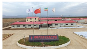
德雷达瓦中土工业园的“园中园”——昆山产业园