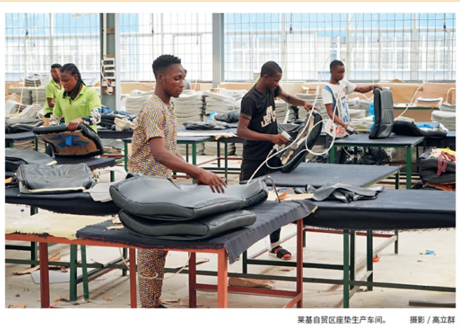
莱基自贸区服装生产车间。