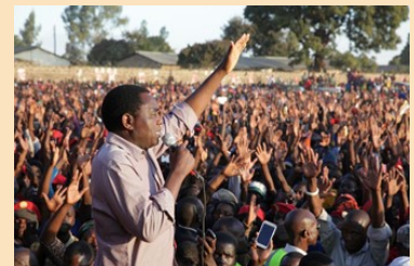
2016年赞比亚大选辩论，执政党候选人伦古缺席