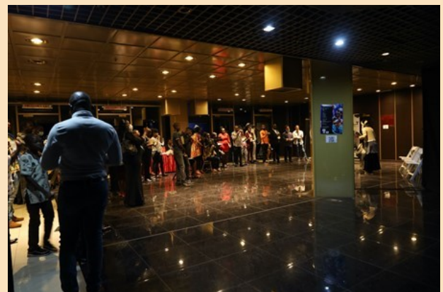
展览开幕现场观众