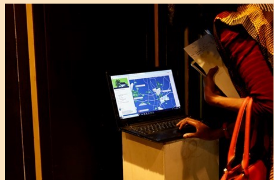
观众与Wynona Mutisi的作品Kumba互动