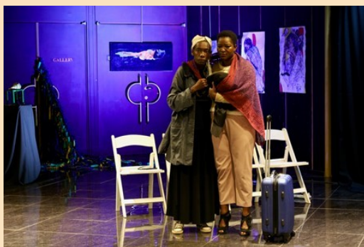
在展览空间内演出的开幕戏剧Delta Estate